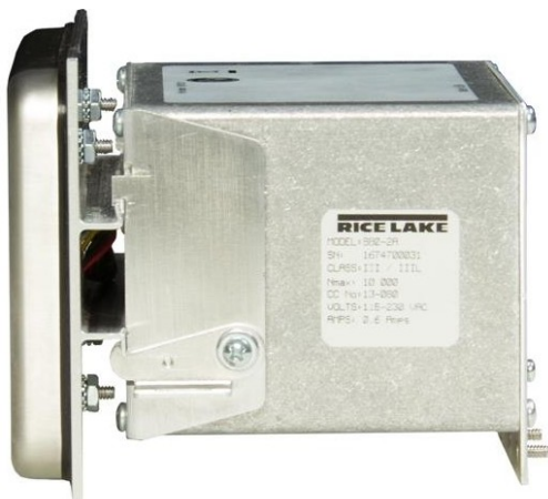
面板安装型侧视图